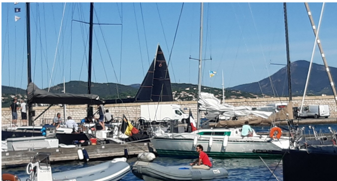
Image : Idéfix à sa place. En arrière-plan Velsheda, un classe « J » remonte la rade.

Dimanche - Jour d'inscription et de préparation. Vider le bateau, et regarder les jolies classiques et modernes.